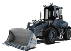
CARGADORES FRONTALES COMPACTOS